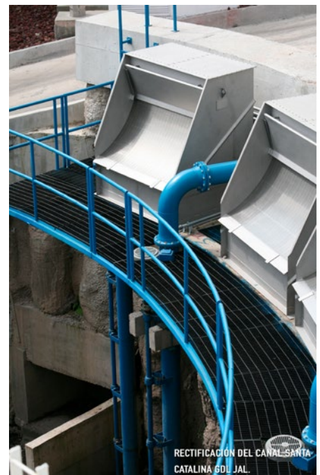
RECTIFICACIÓN DEL CANAL SANTA CATALINA GDL JAL.